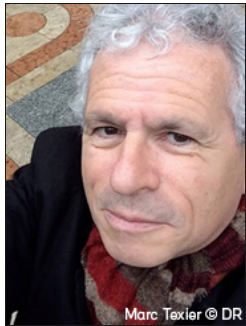
Marc Texier © DR

«Les femmes ont toujours été présentes dans l'art du XXe siècle, et dans une proportion qui va sans cesse croissant, mais leur présence a été occultée. Je veux montrer leur présence, et aussi la difficulté qu'elles ont eue à se faire reconnaître.»