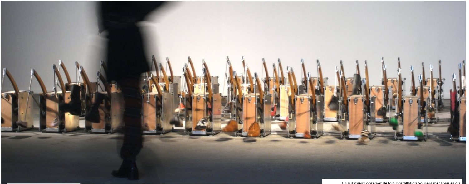
Il vaut mieux observer de loin l'installation Souliers mécaniques du plasticien français Arno Fabre pour ne pas risquer de se faire botter... © Arno Fabre